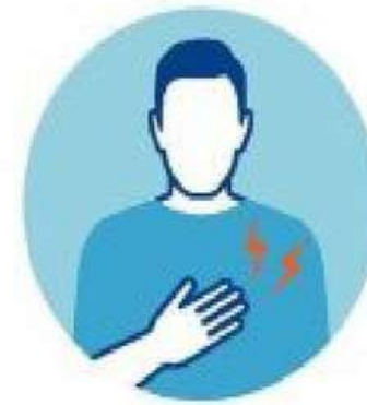
БОЛЬ В МЫШЦАХ