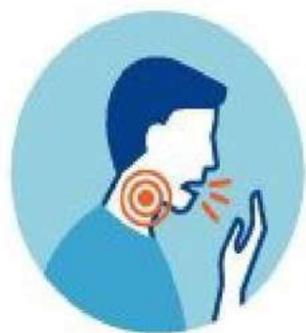
КАШЕЛЬ И/ИЛИ БОЛЬ В ГОРЛЕ