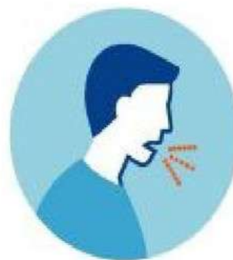
ВОЗДУШНО- КАПЕЛЬНЫЙ ПУТЬ

Через зараженные поверхности – рукопожатия, поручни в транспорте, дверные ручки, другие предметы и поверхности.