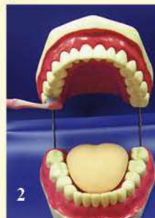
Рис. 3.1. Неверная тактика чистки зубов:

Рис.2 Чистка начинается с жевательной поверхности верхних правых зубов; по часовой стрелке движемся вдоль зубного ряда верхних и нижних зубов, завершаем чистку на нижних правых зубах.