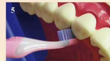
Рис.5. Концевыми и боковыми щетинками зубной щетки очищаем боковые поверхности зубов со стороны языка и неба.

Рис.6. Тщательно очищаем небные и язычные поверхности передних зубов концевыми щетинками зубной щетки.