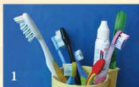
Рис.1 Приготовьте средства для чистки зубов

Рис.2 Чистка начинается с жевательной поверхности верхних правых зубов; по часовой стрелке движемся вдоль зубного ряда верхних и нижних зубов, завершаем чистку на нижних правых зубах.