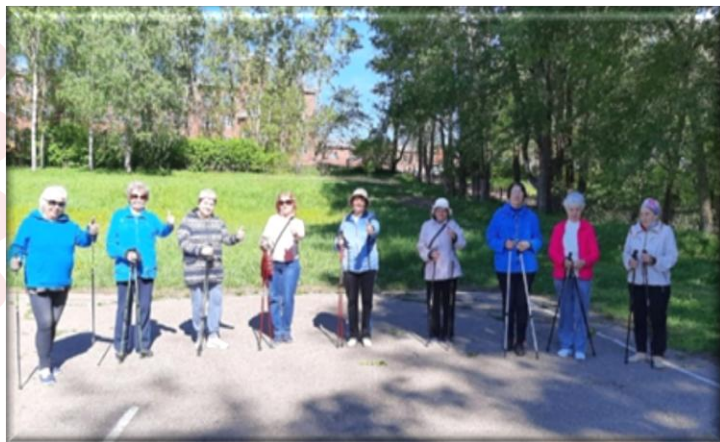
Мастер-класс по Скандинавской ходьбе