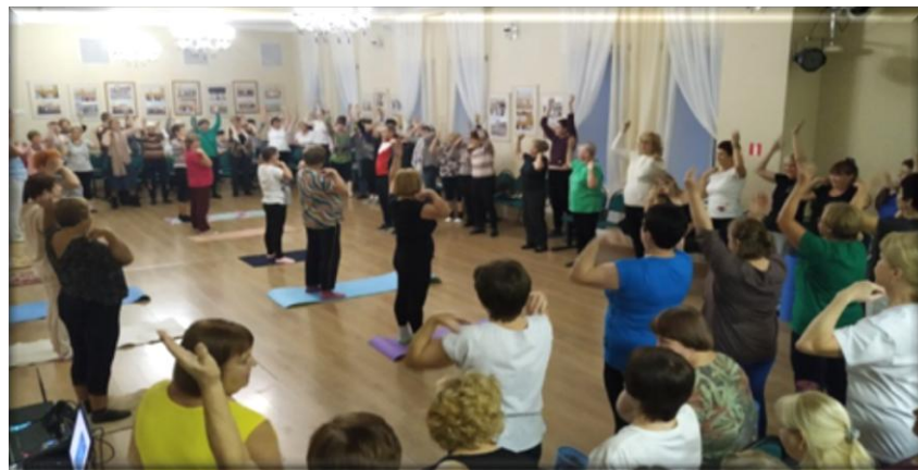
Мастер-класс «Живой позвоночник»