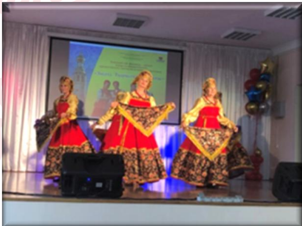
Танцевальный коллектив «Задоринки», г. Вологда