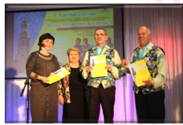
Церемония награждения победителей и участников