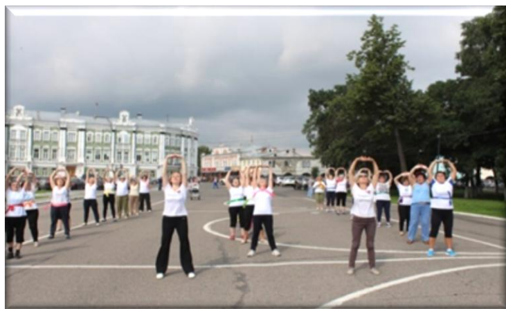
Зарядка «Бодрое утро»