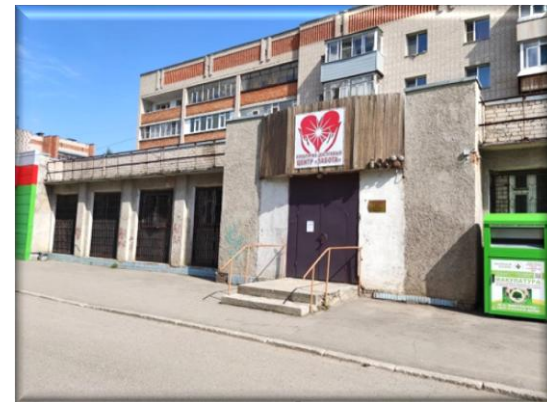
Ул. Пионерская, 28