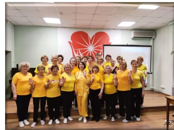
Занятие в группе «Цигун»