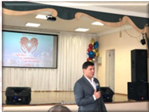
Открытие Форума. Участников приветствует Мэр города Вологды С.А. Воропанов