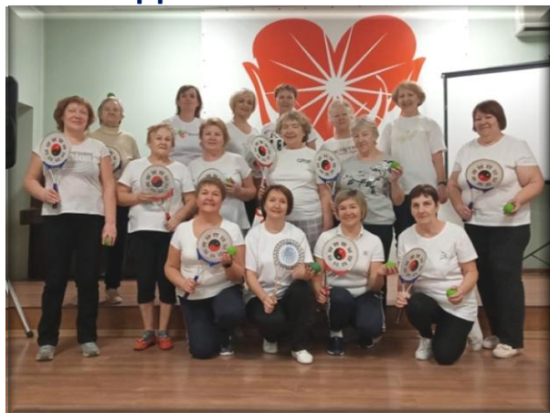
Занятие в группе «Плейстик»