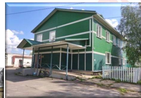
Ул. Монастырская, 16