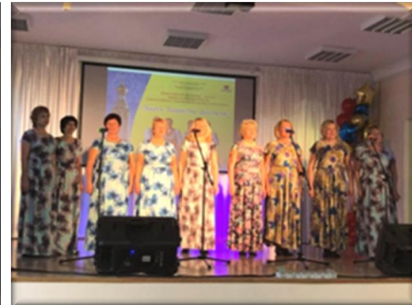
Вокальный ансамбль «Букет» г. Вологда