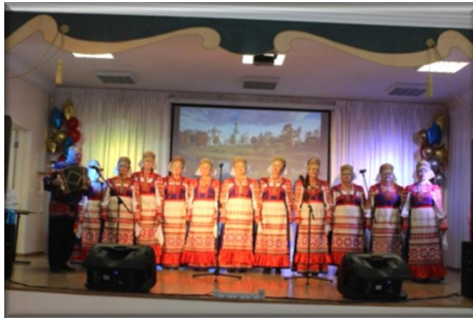
Ансамбль народной песни, поселок Вожега Вологодской области