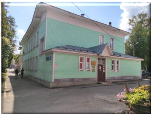
Ул. Мальцева, 20