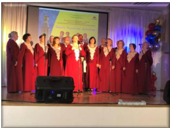
Вокальный ансамбль «Оптимисты», г. Вологда