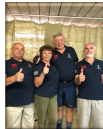
Городская летняя Спартакиада пенсионеров