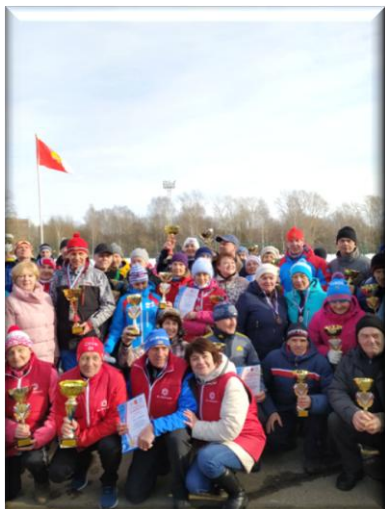
Областная зимняя Спартакиада пенсионеров, 1 место в общекомандном зачете