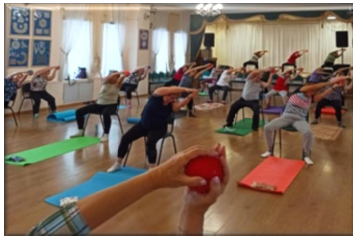
Занятие в группе «Пилатес»