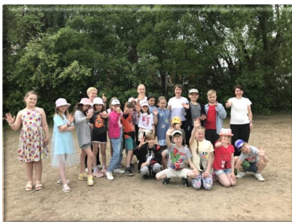
Мастер-класс для детей в рамках проекта «Город детства»