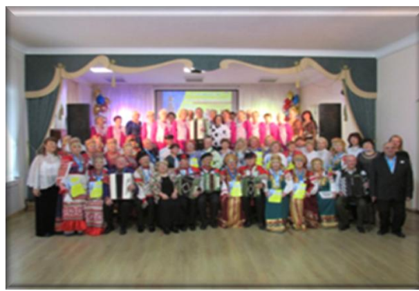
Участники фестиваля после гала-концерта