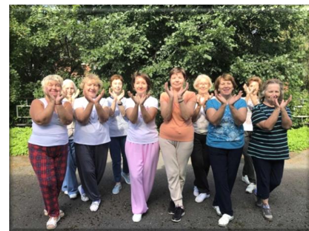
Мастер-класс «Оздоровительный Цигун»