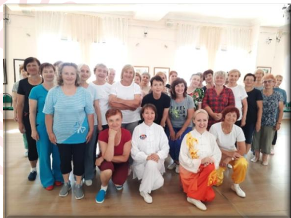
Занятие в группе «Даоинь Каньян»