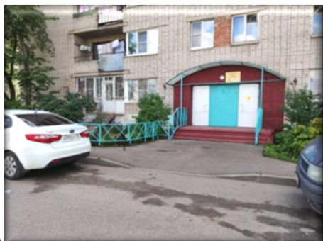
Ул. Преображенского, 49